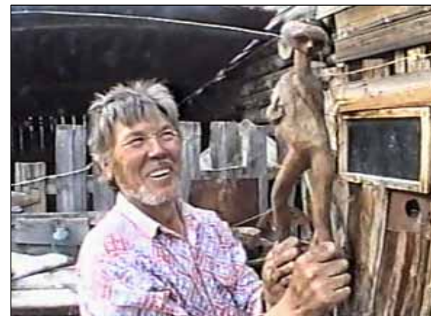
№ 156. Кадр из очерка «Чабан»