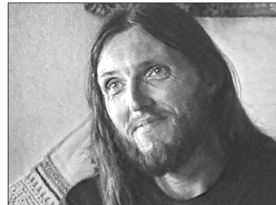
№ 161. Кадр из очерка «Виссарион. Последний Завет»»

- Встречаясь с тем или иным человеком, - сказал он мне, - я как бы знаю его и отвечаю на таком уровне, как ему надо услышать.