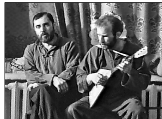
№ 160. Кадр из передачи «Русская тропа»

В конце концов, дядьки разрешили снимать уроки древнерусского танца, правда, кроме лекции о колдунах.