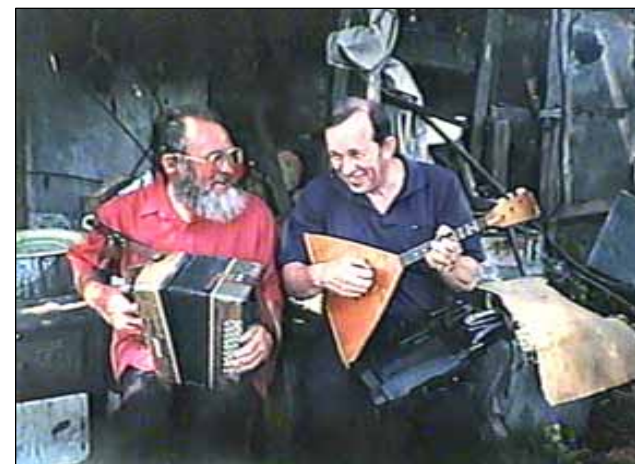
№ 158. Кадры из очерка «С песней по жизни»