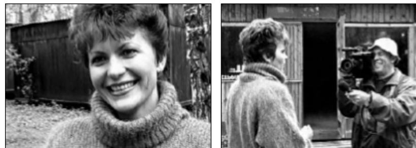
№ 159. Кадры из передачи «Игры, в которые играют люди»

Слева то, что снимаю я. Справа то, что снимает другой оператор.